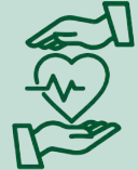
ARBEITNEHMERSCHUTZ & GESUNDHEITSBENEFITS